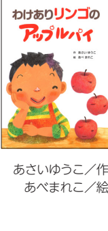
あさいゆうこ/作 あべまれこ/絵