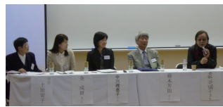
「日本児童文学学会 第52回研究大会」