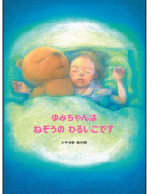
みやざきあけ /作・絵