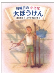
愛川美也／作 みやざきあけ美／絵